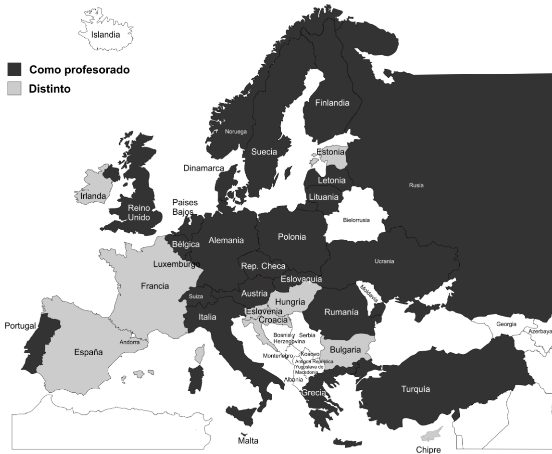
Mapa 12. Estatus del profesorado.