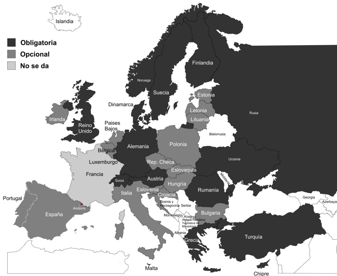
Mapa 5. Obligatoriedad u opcionalidad en la enseñanza religiosa.