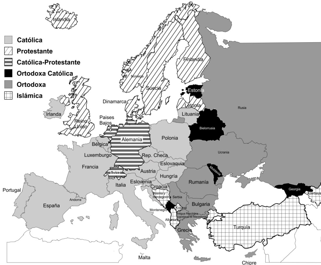
Mapa 1. Religiones mayoritarias en cada país de Europa.

Como conclusión diremos que de estas normas se desprende el deber de los Estados miembros de: