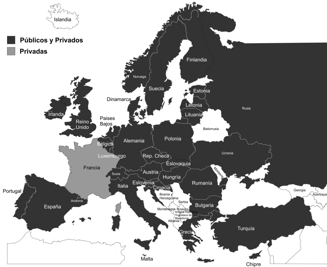
Mapa 9. Tipos de escuelas en que se imparte la enseñanza religiosa.