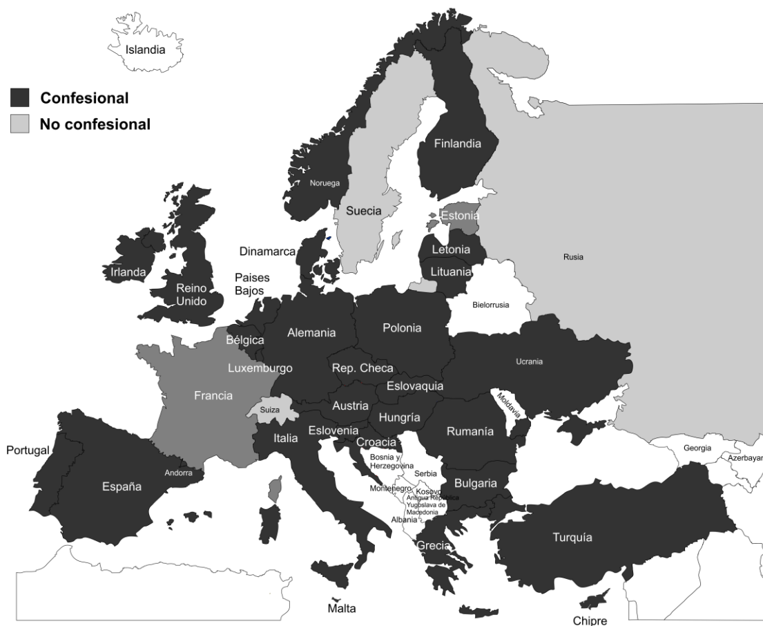
Mapa 7. Confesionalidad de la enseñanza religiosa.