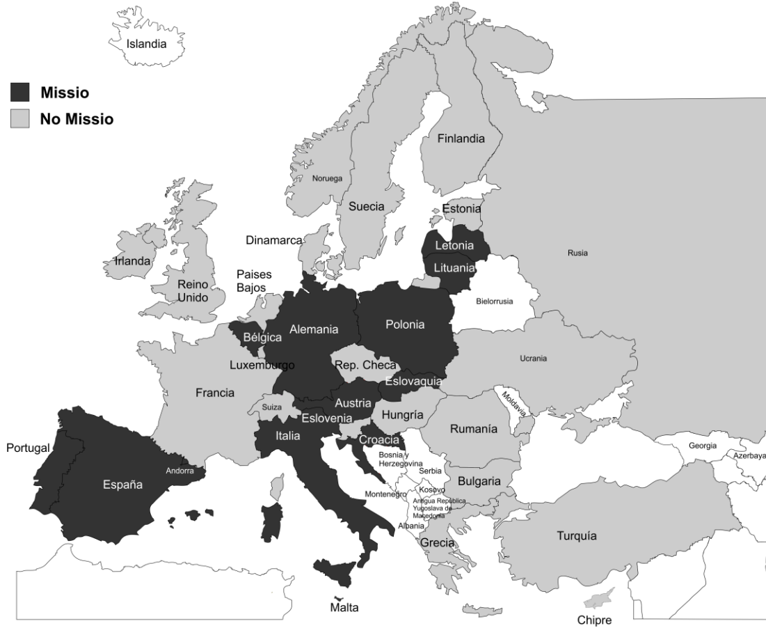
Mapa 13. Países que requieren missio canonica .