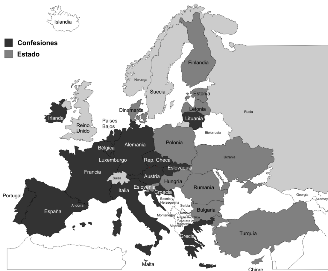
Mapa 10. Determinación de la enseñanza y libros de texto.

También Suiza, el Reino Unido donde en las escuelas públicas son aprobados por el Consejo Educativo Local, aunque con participación de las iglesias, y Rusia 16 donde la asignatura está fijada por el gobierno al no tener carácter confesional.