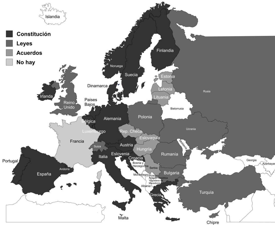
Mapa 3. Fundamentación legal de la clase de religión.

Respecto a la enseñanza religiosa católica, la Santa Sede tiene acuerdos con numerosos países que regulan este aspecto de la educación.