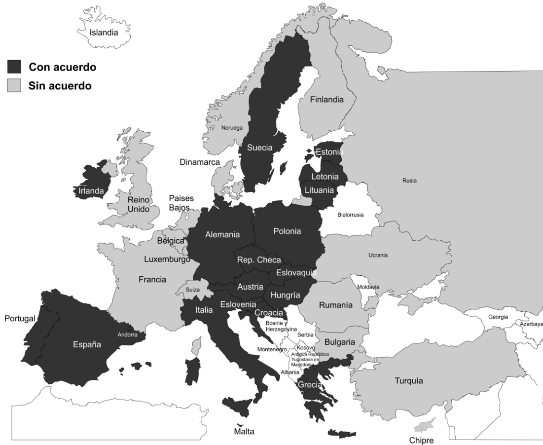
Mapa 4. Países con Acuerdos con la Santa Sede que tienen referencia a la enseñanza.