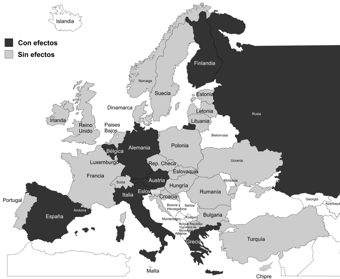
Mapa 6. Efectos académicos de la clase de religión.