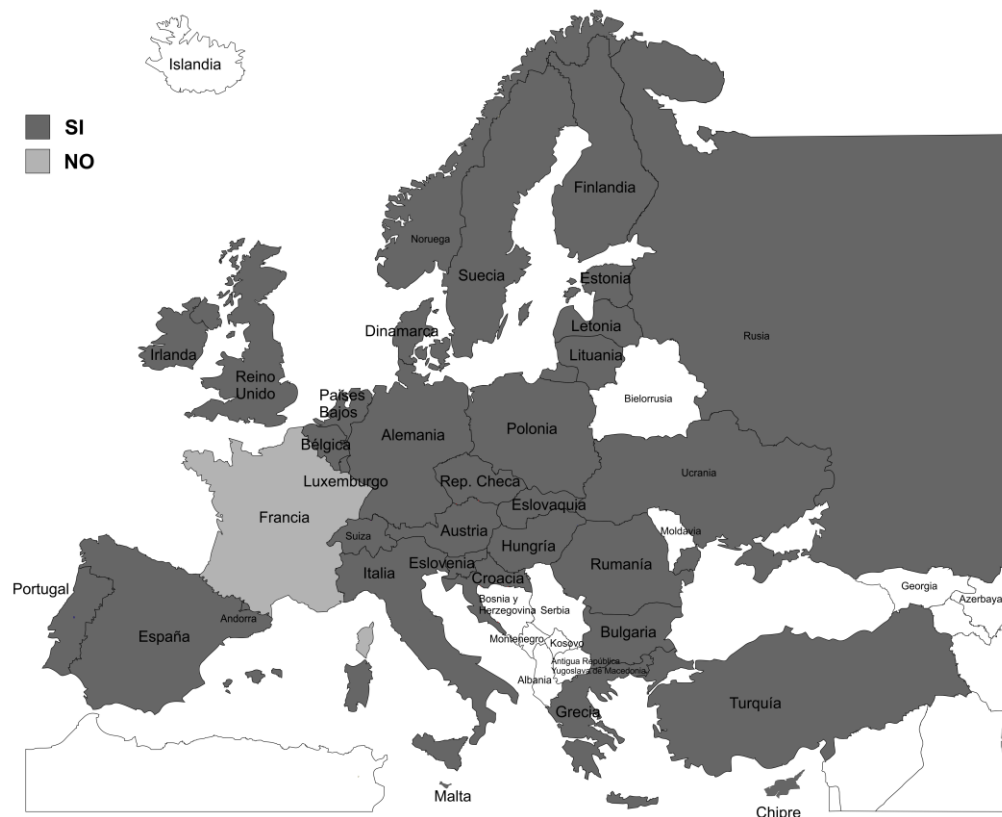
Mapa 2. Países en que se imparte enseñanza religiosa en las escuelas.