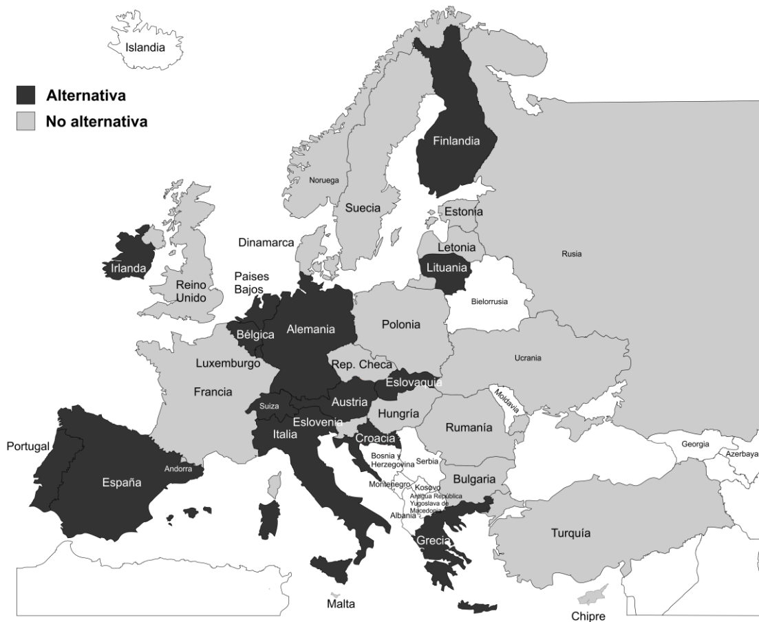
Mapa 8. Países con alternativa a la clase de religión.

En esta misma línea, debemos decir que estas materias alternativas generalmente versan sobre temas éticos, morales y sociales.