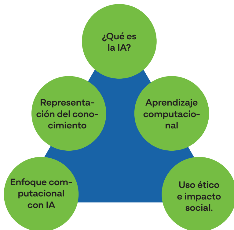
Dimensiones del marco referencial para la enseñanza de la IA.

Las dimensiones son temas, conceptos o ideas poderosas que sirven para diseñar e implementar propuestas pedagógicas. Se relacionan de forma directa con las competencias promovidas para avanzar en el proceso de alfabetización en IA (Kim et al. , 2021; Long y Magerko, 2020; Ng et al. , 2021; Olari y Romeike, 2021; Sentance y Waite, 2002).